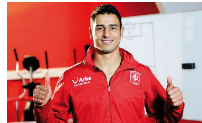
‘Wat zou het lievelingsgerecht zijn van Nacer Chadli? Doe mee en kom er achter!’

manier over de streep trekken om iets te doen voor hun eigen gezondheid. De moeite die dit in het begin kost, levert heel veel op. Je voelt je fitter, krijgt weer plezier in bewegen en dat merk je in het dagelijks leven.’