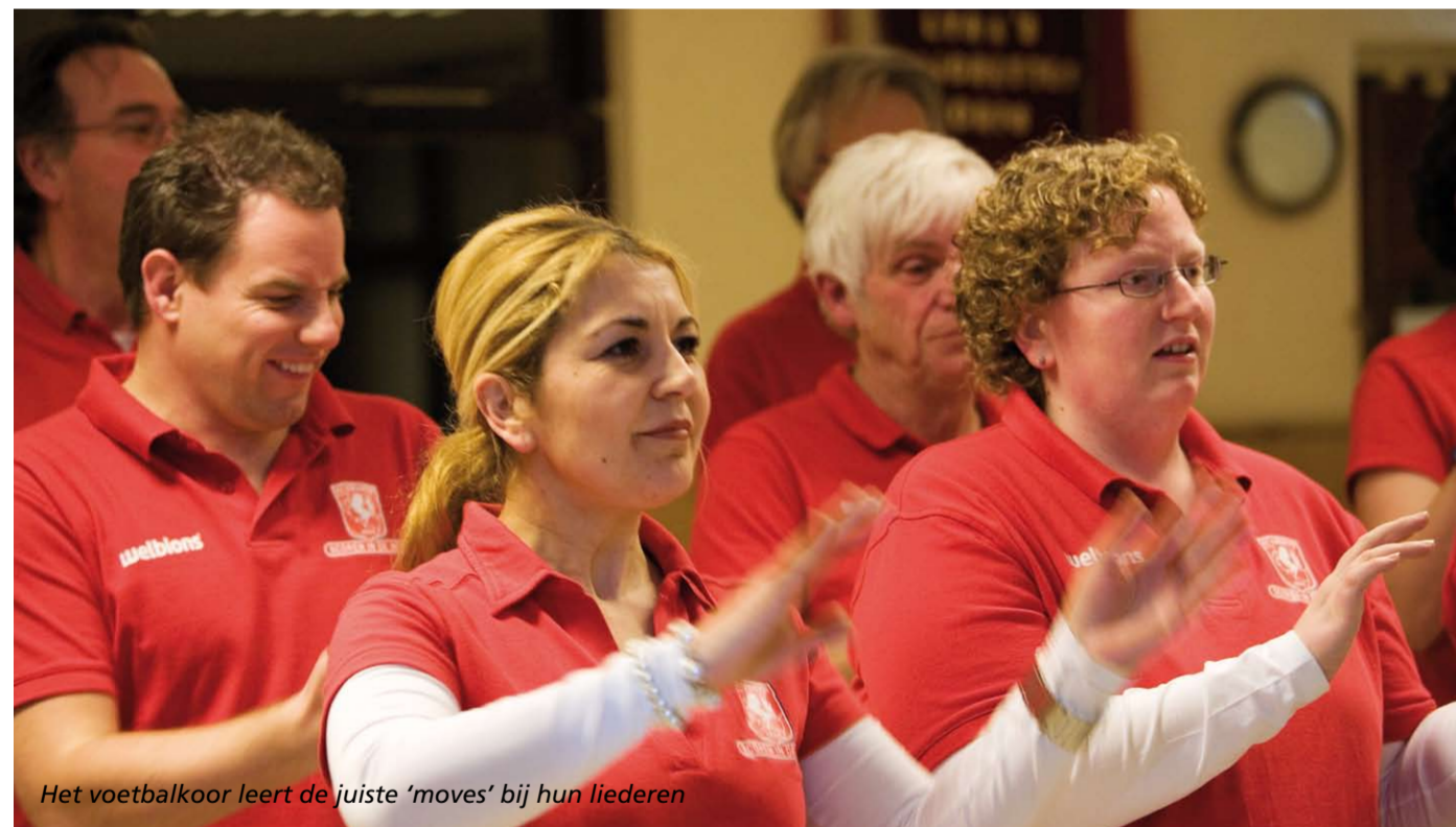
Het voetbalkoor leert de juiste ‘moves’ bij hun liederen

Met ‘hasj, coke en pillen’ op pad, bittere tranen als Twente wordt ‘verbrast’ en ‘Goat stoan aj’ veur Twente bint’. Want: ‘You’ll never walk alone!’ Vanaf april vorig jaar oefenen ze elke donderdagavond: het voetbalkoor van Stichting FC Twente, scoren in de wijk. U kon al naar ze luisteren bij verschillende optredens, zoals het meezingfestival bij het FBK-stadion in juni. En bent u pas geleden naar een wedstrijd van FC Twente geweest? Dan heeft u ze vast gehoord. Sinds eind februari brengen ze in de omloop op de 2e ring de sfeer er alvast goed in.