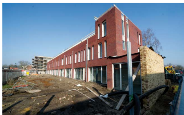
Klimopstraat: woningen in aanbouw

De oude flat is gesloopt en ook hier zijn we momenteel druk bezig met het aanleggen van de infra (riool, water en elektra) zodat verderop in het jaar gestart kan worden met de bouwwerkzaamheden.