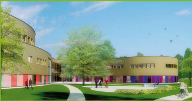
Impressie van de MFA/Brede School

Kijk op www.bredeschoolhengelo.nl om te zien waar de Brede School Berflo Es op dit moment mee bezig is.